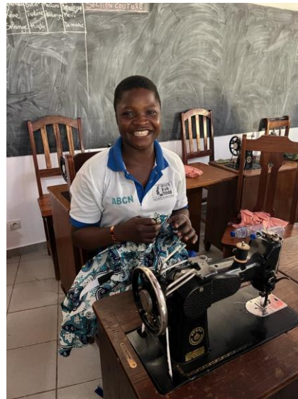
Auszubildende zur Schneiderin