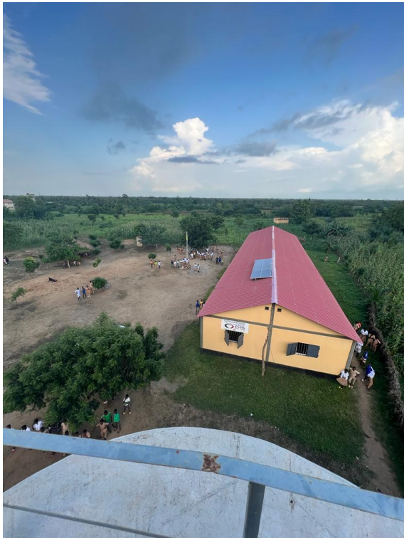
Blick auf die von Hassel-Schule vom Trinkwasser-Hochbehälter