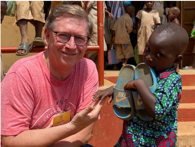
Impressionen Schulbesuch in Togo