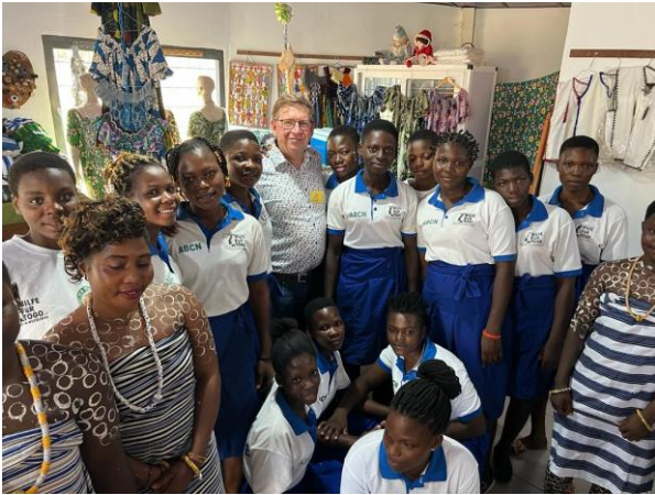
Landrat Stefan Rößle mit den Schneider-Lehrlingen des Berufsschulzentrums Kpalime