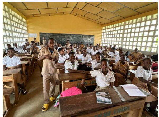
Impression neues Schulgebäude in Togo