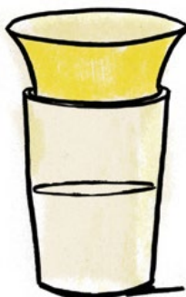
Becher mit kleiner Öffnung im Deckel und breiterem Rand