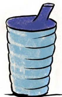
Schnabelbecher mit Griff-Rillen