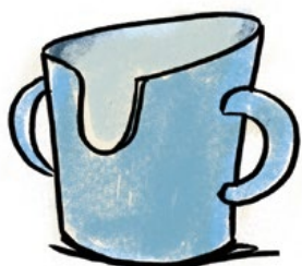
Becher mit Griffen und Aussparung für die Nase

Gefäße mit Griffen, Rillen oder Vertiefungen lassen sich besser greifen und festhalten. Sie können beispielsweise hilfreich sein, wenn es an Kraft und Beweglichkeit in den Händen fehlt. Für Menschen, die den Kopf schlecht bewegen können oder Schluckprobleme haben, gibt es speziell geformte Gefäße: Beim sogenannten Nasenbecher (→ Abbildung unten links) muss der Kopf beim Trinken nur leicht nach hinten geneigt werden. Das gilt auch für Becher mit breitem Rand und einer kleinen Öffnung im Deckel (→ Abbildung unten Mitte). Damit lässt es sich besser in kleinen Schlucken trinken. Auch Schnabelbecher (→ Abbildung unten rechts) können das Trinken erleichtern. Sie sind jedoch für Menschen mit Schluckproblemen (→ Seite 21) nicht geeignet, da Getränke unkontrolliert in Mund und Rachen gelangen können. Hilfreich beim Trinken können außerdem gebogene Strohhalme sein, die bis auf den Boden des Gefäßes reichen.