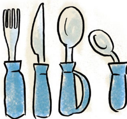
Aufsteckbare dicke Griffe und gebogener Löffel

Spezielles Besteck kann sinnvoll sein, wenn die Hände und Arme weniger kräftig oder beweglich sind. Es gibt zum Beispiel Messer, Gabeln und Löffel mit dicken geriffelten Griffen oder gebogenes Besteck. Das Gewicht des Bestecks sollte gleichmäßig verteilt sein. Aufsteckbare Griffe sind in verschiedenen Längen erhältlich. Sie können in unterschiedlichen Winkeln am Besteck angebracht werden. Vertiefte Löffelschalen helfen, Flüssigkeiten sicherer in den Mund zu befördern.